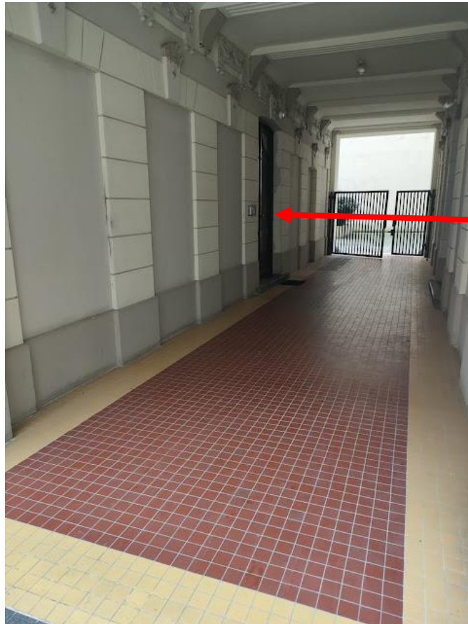
Wejście do Centrum Domofon 100 Parter