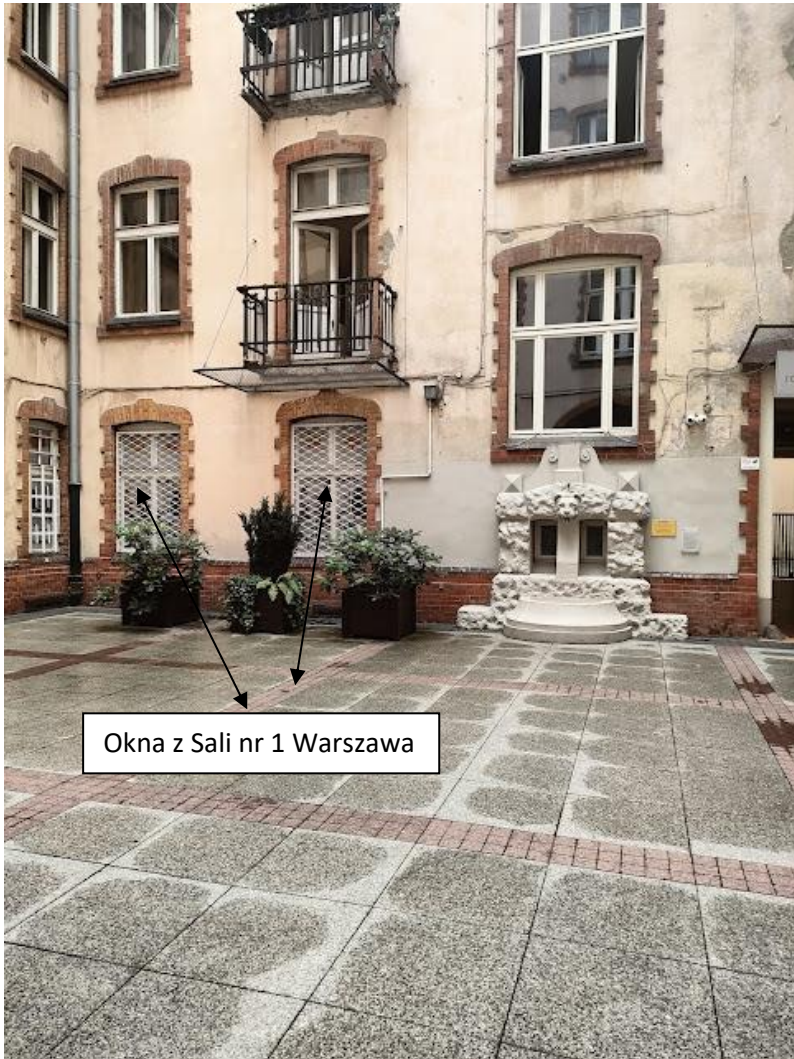
Okna z Sali nr 1 Warszawa